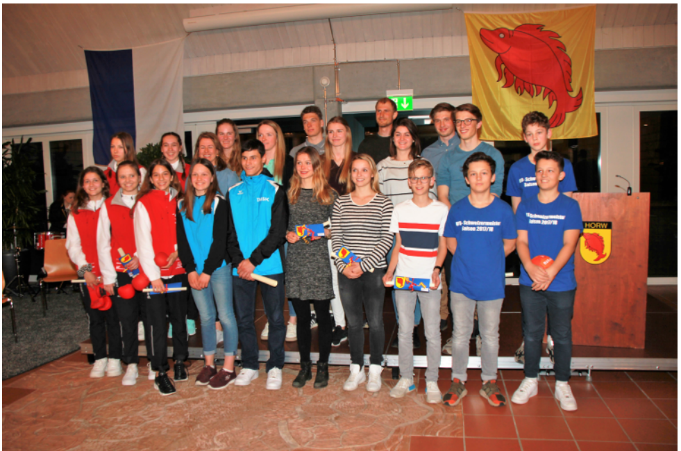
Gruppenbild der geehrten Sportlerinnen und Sportler 2018